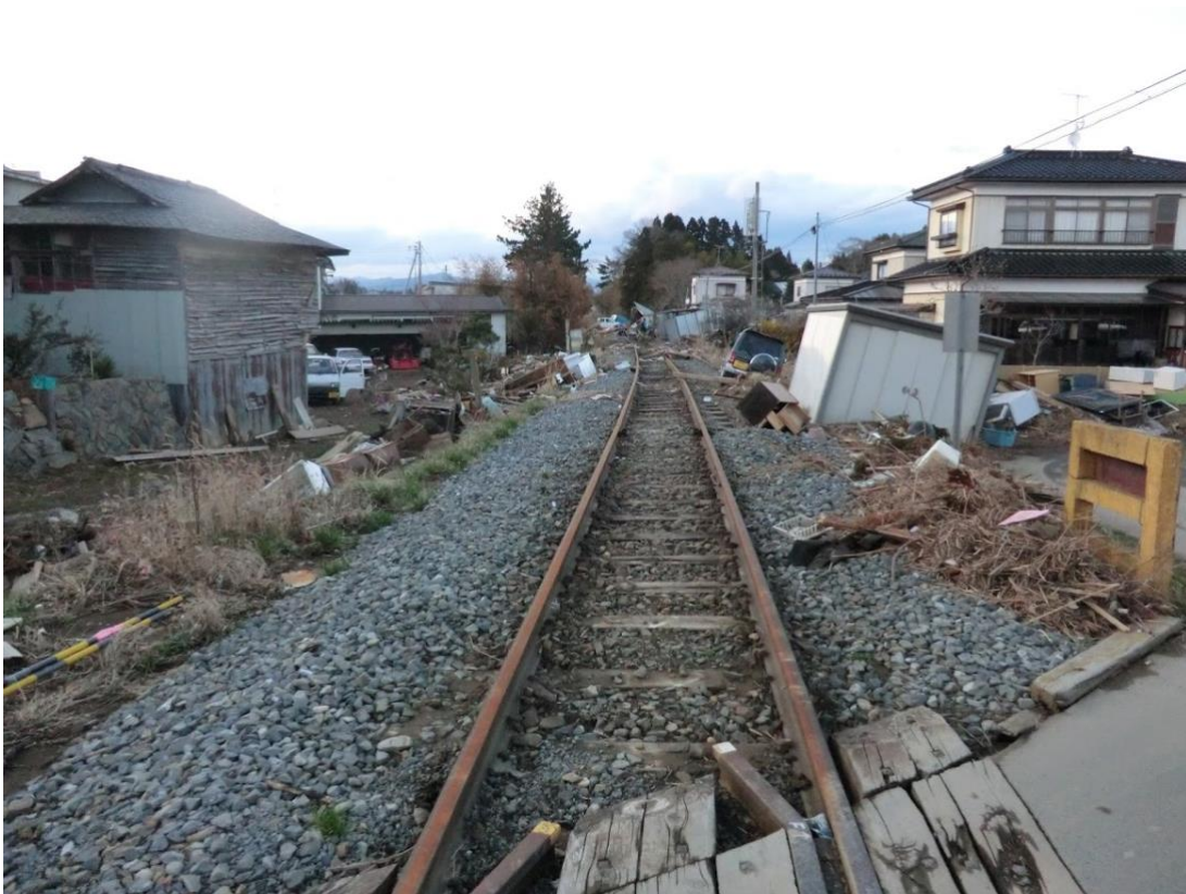
図 2. 2011 年東日本大震災より 1 か月後の被災地

COVID-19感染拡大を防ぐためにロックダウンや外出制限が行われ、児童思春期が大きなストレスを感じた